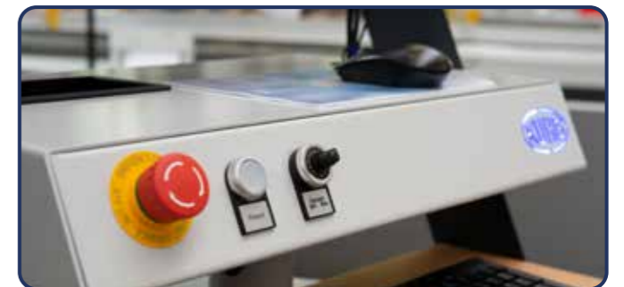
Neues Bedienpult mit Kontrollleuchte und Touchdisplay