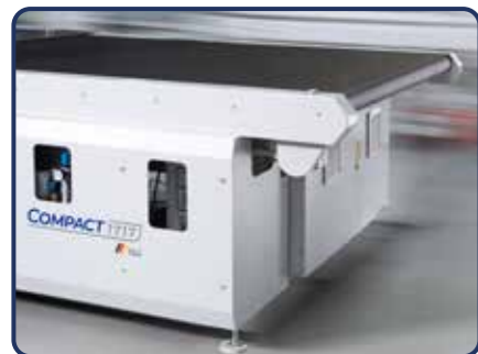
Platz hinter dem Abräumband für Auffangbehälter.