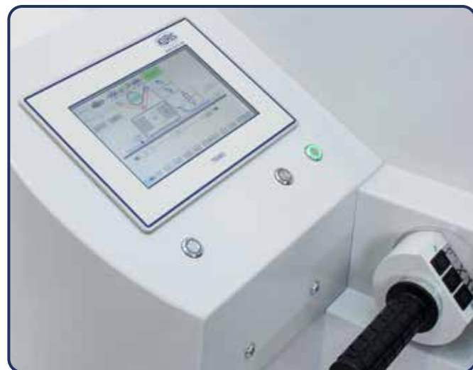
Touch-Panel mit grafischer Oberfläche für leichte und übersichtliche Bedienung.

Die Kuris A55 Legemaschine ist für kritische, glatte Stoffe oder auch schlecht gewickelte Stoffrollen, mit unterschiedlichsten Oberflächen bestens geeignet. Durch das neue Umlenkrollen-System der angetriebenen Mulde bzw. Stoffstange ist eine ausgezeichnete Legequalität sichergestellt. Auch beim vollautomatischen Legen von spannungssensiblen Materialien werden exzellente Legeergebnisse erzielt. Die präzise geregelte Stoffvorgabe kann exakt der benötigten Legegeschwindigkeit angepasst werden. Die halb-/vollautomatische Aus- bzw. Einfädelung des Stoffes reduziert die Rüstzeiten erheblich. Viele Legeschritte mit unterschiedlichen Anlege- und Schneidpunkten, Stofflagenanzahlen, Zick-Zack Legeprogrammen sowie zahlreiche weitere materialspezifische Parameter lassen sich individuell programmieren.